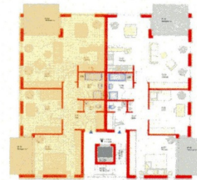
Haus 2 1. Obergeschoss