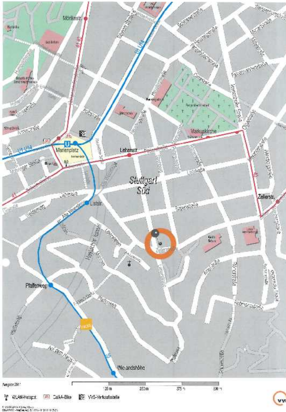
Stadtplanausschnitt Stuttgart Lehenstraße 35