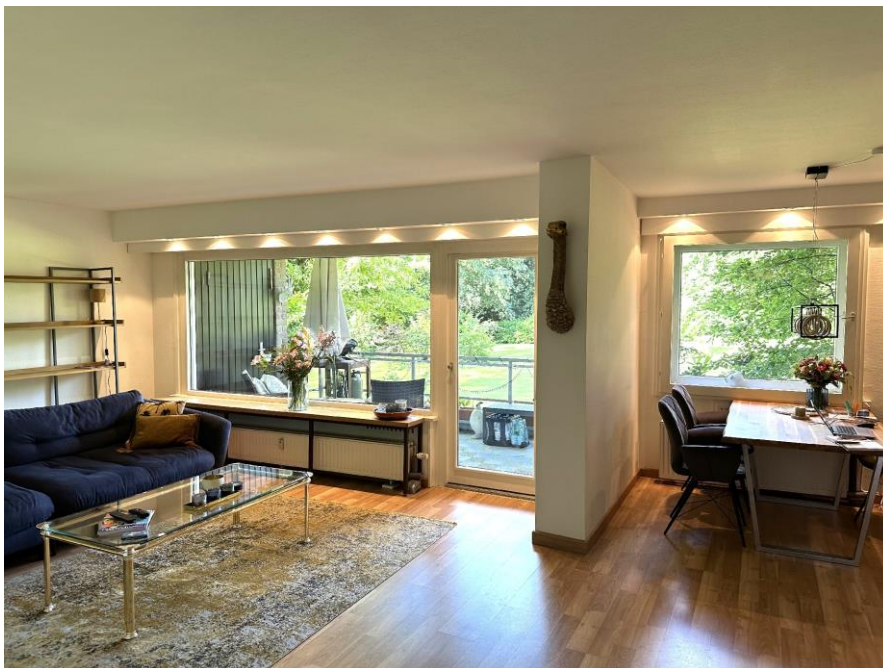
Wohnzimmer mit Balkonzugang