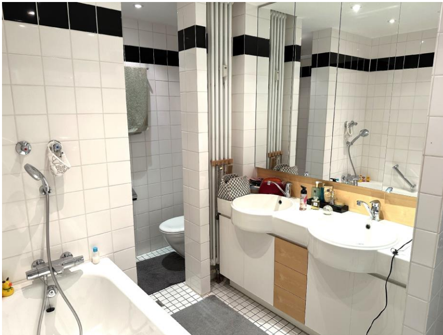
Bad mit Wanne