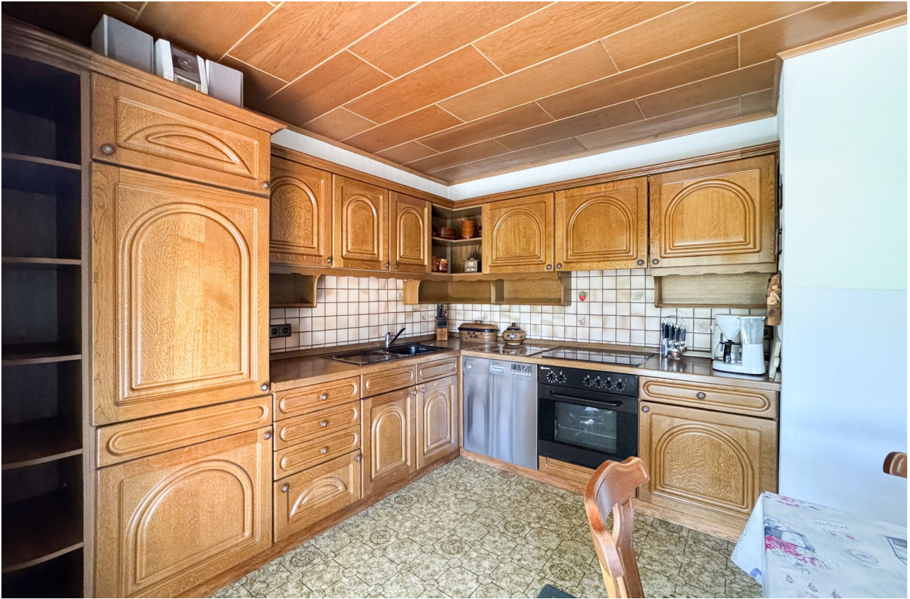
Große Küche mit Zugang zur Terrasse und zum Garten