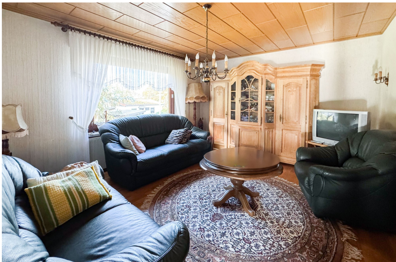
Wohn- und Esszimmer