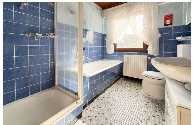
Badezimmer mit Wanne und Dusche