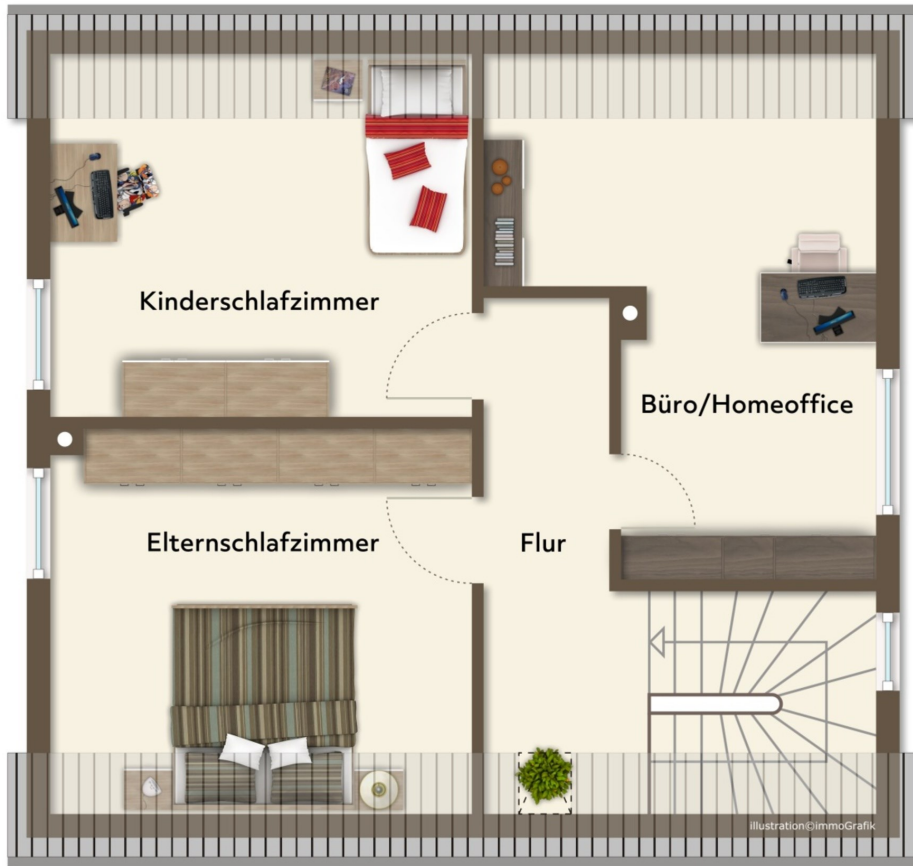
Aktueller Zustand der Raumaufteilung