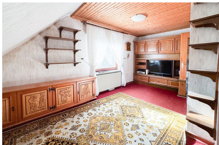
Weiteres Schlaf- zimmer oder Homeoffice