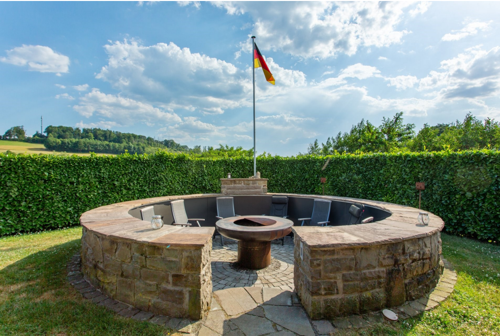
Sitzbereich mit Feuerstelle