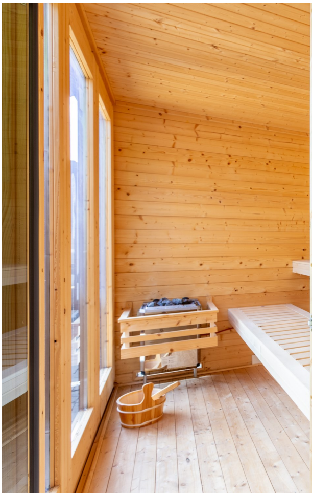
Große Außensauna mit Vorraum