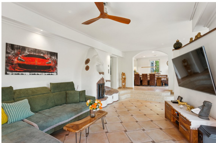
Wohnbereich mit Kamin