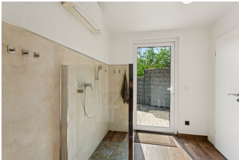
Hundedusche mit Zugang in den Garten