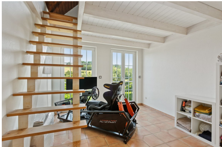
Zimmer mit großer Schlafempore