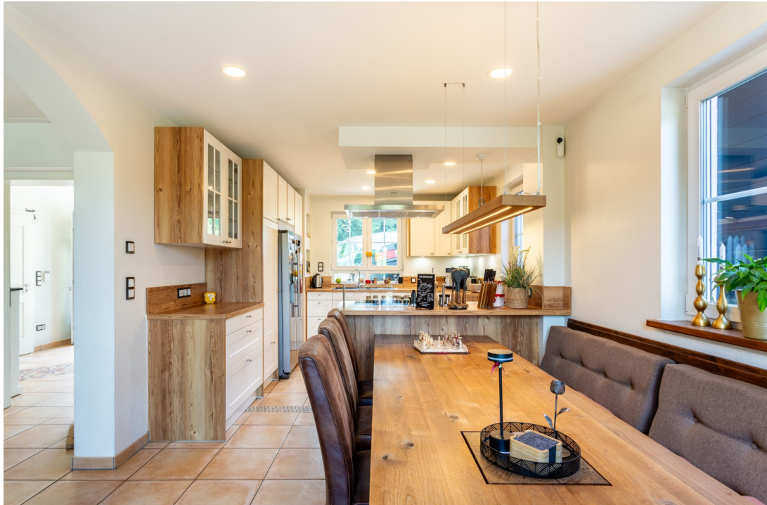
Küche mit Essbereich