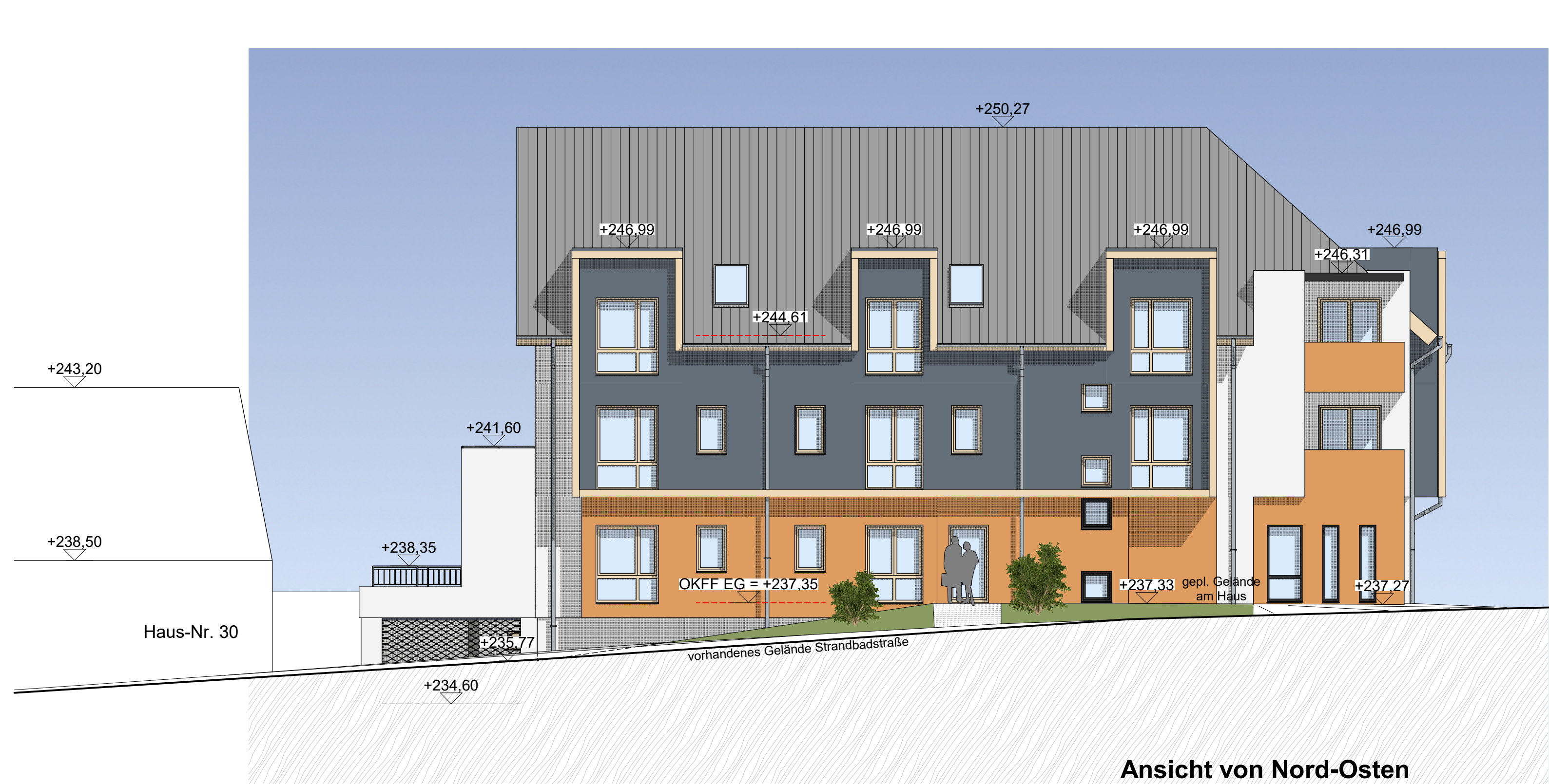
Ansicht von Nord-Osten