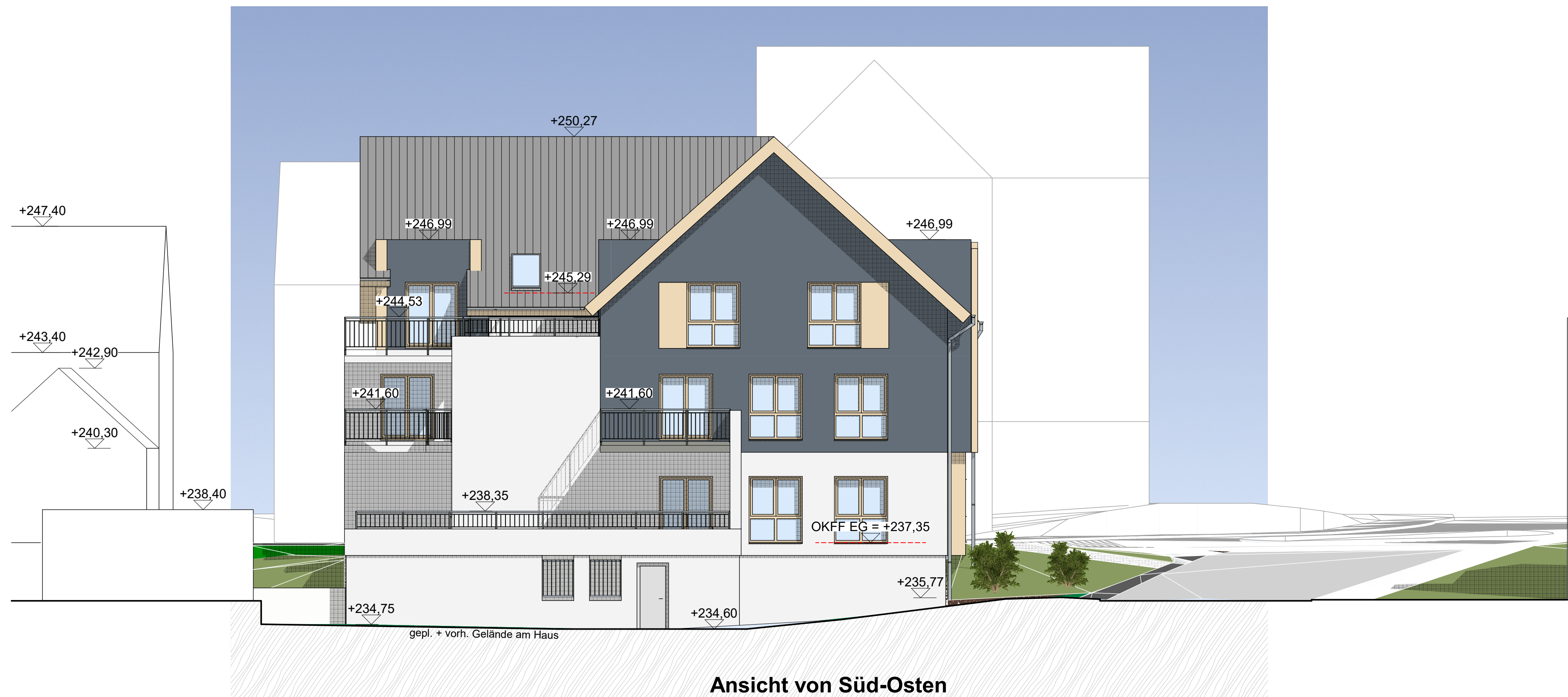
Ansicht von Süd-Osten